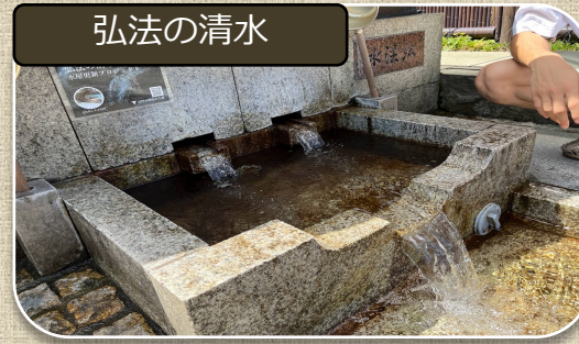
伝説のある弘法の清水 おいしさ1位の秦野水を体感し、汲もう

その他：豆の焙煎には40分程度かかるため、その間に、弘法山で食べる昼食を買う。またコーヒーと食べるお菓子を買う場合もこの時間で済ませる。 弘法山滞在時間は30分