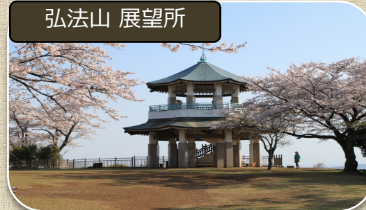
大絶景を見ながらコーヒーを焙煎、 季節と自然を体感し、至高のひとつとき