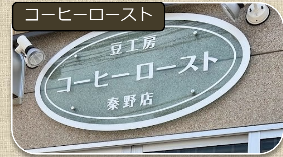
あまりの香ばしい香りに心から癒される コーヒー豆を手に入れよう